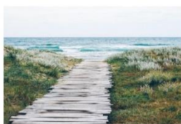
Lectures d'été sur la mer : 8 idées pour s'instruire