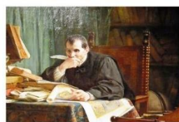
Discours sur la première décade de Tite-Live