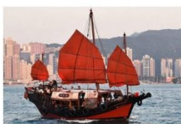
L'Asie et la mer au cœur des articles de l'été du FDBDA