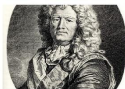
Le Projet de paix assez raisonnable de Vauban